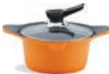
Кастрюля 2 л Диаметр: 18 см