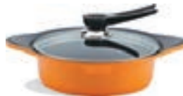
Сотейник 3 л Диаметр: 24 см