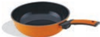
Вок Диаметр: 28 см