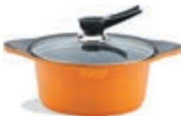
Кастрюля 4 л Диаметр: 24 см